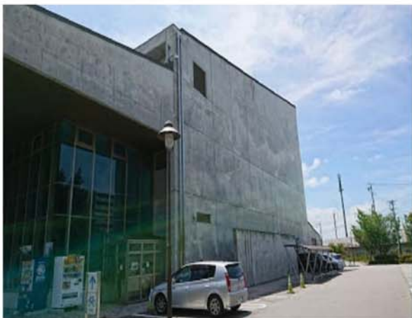
佐久平交流センター