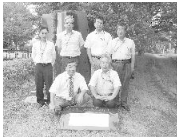
記念碑の前で、新編集委員