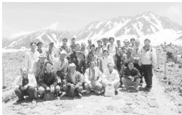
室堂平にて立山を背景に